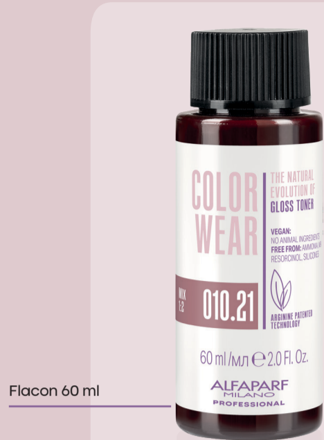
Flacon 60 ml

Datorită experienței în crearea produselor, Alfaparf Milano Professional a realizat o formulă care este foarte performantă și blândă cu părul.