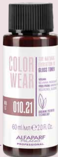
Frasco 60 ml

A expertise formulista da Alfaparf Milano Professional deu vida a uma fórmula delicada no cabelo e ao mesmo tempo com boas performances.