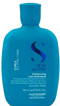
Enhancing Low Shampoo